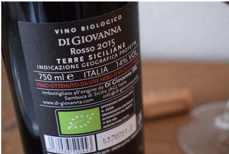
Helios Rosso Terre Siciliane IGP 2015 Di Giovanna

Il vino di punta aziendale è il rosso Helios, un Terre Siciliane IGP di grande eleganza e dal buon rapporto qualità/prezzo. Il vino è un blend di uve Nero d'Avola e Syrah accuratamente selezionate nei vigneti di Contessa Entellina. Macerazione a caldo, e lunga fermentazione con lieviti selezionati a temperatura controllata. Dopo la fermentazione malolattica il vino riposa per 12 mesi in barrique nuove di media tostatura, e ben 18/24 mesi in bottiglia prima della sua commercializzazione. Io ho avuto modo di degustare la vendemmia 2015, e cioè l'ultima disponibile in commercio.